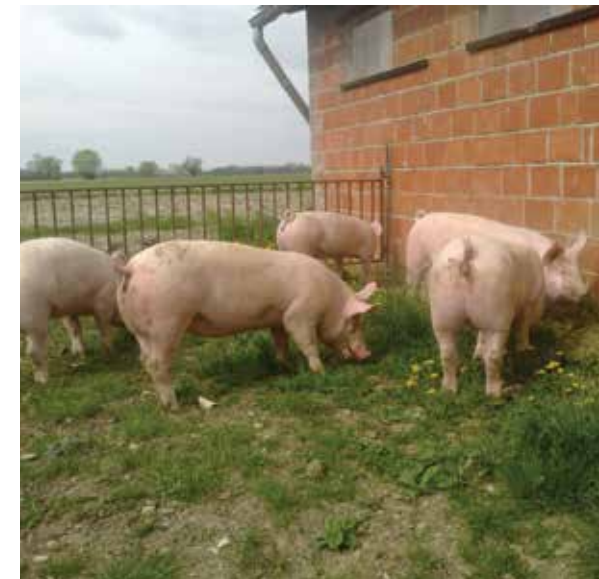
Slika: Izvor Hrvatska poljoprivredna agencija

Za korištenje ovog tipa operacije svinjama morate omogućiti stalan ili povremen pristup otvorenom ispustu najmanje 2 puta tjedno u trajanju od najmanje 2 sata.