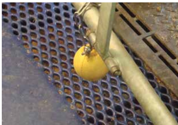
Slika: „igračaka za zanimaciju svinja“ Finska

Rezanje repova kod prasadi i svinja u tovu počelo se primjenjivati kao mjera za sprečavanje pojave kanibalizma u tovu. Pojavi kanibalizma pogoduju intenzivna proizvodnja, suha prehrana, nedovoljne količine sirovih vlakana u krmnoj smjesi, nedostatak nekih mikroelemenata u hrani, pljesniva hrana i nedostatna ventilacija te nedostatak „igračaka za zanimaciju svinja“.