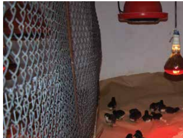
Slika: Izvor Hrvatska poljoprivredna agencija

Obveza je tijekom prvih tjedan dana, za jednodnevne piliće i puriće, na područje za hranidbu postaviti papir gramature od najmanje 110 gr/m 2 .