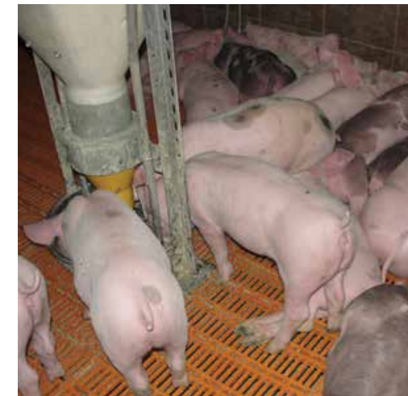
Slika: Izvor Hrvatska poljoprivredna agencija