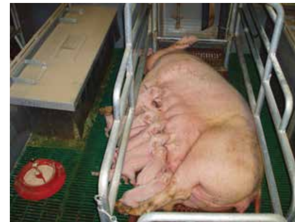
Slika: termodaska u prasilištu s natkrivenim gnijezdom

temperaturu utječe vrsta poda. Temperatura, ovisno o kategoriji svinja uz optimalnu vlažnost zraka od 50% do 75%, iznosi za: