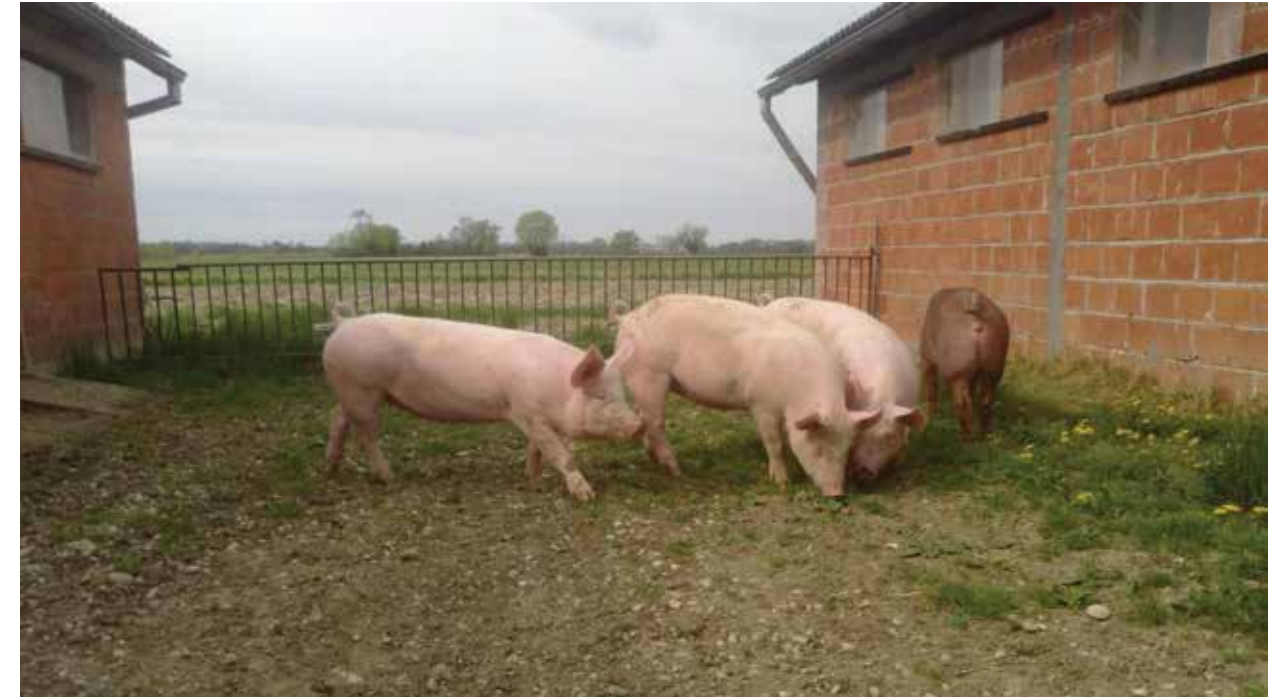
Slika: Izvor Hrvatska poljoprivredna agencija