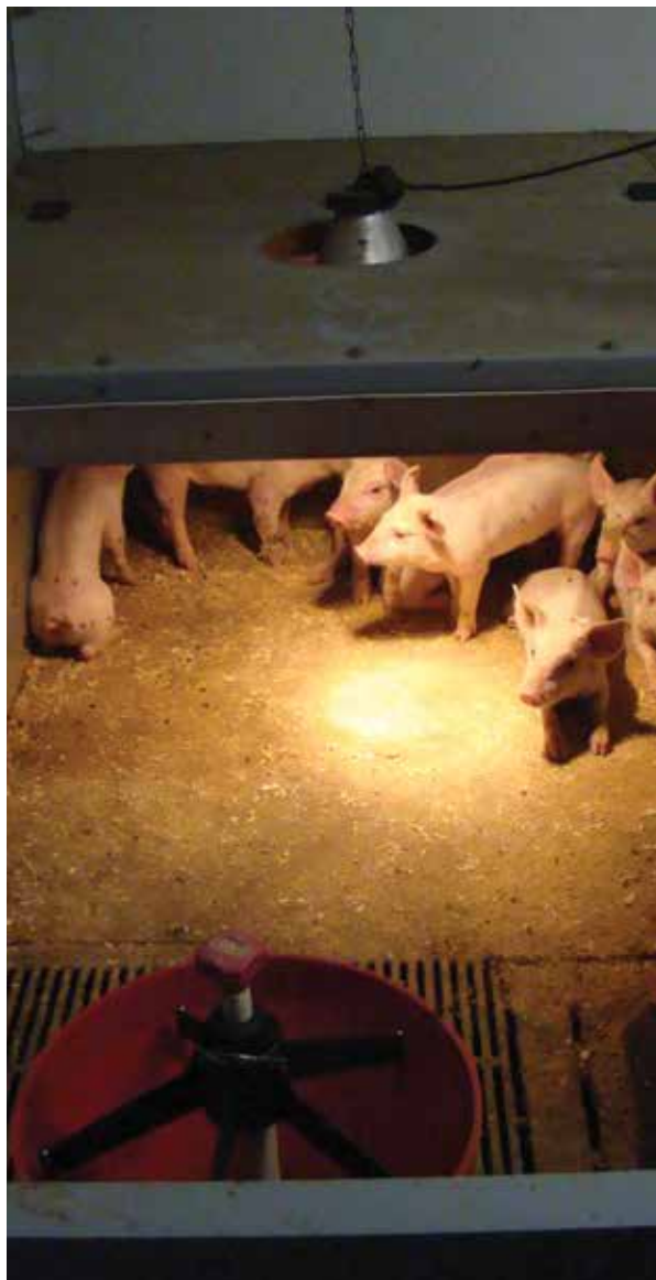
Slika: Primjer iz Finske

Novorođena, odnosno sisajuća prasadi ima veće zahtjeve za toplinom od krmača, jer im temperatura tijela nakon poroda padne za 1,5°C do 2°C te se vrati u normalu za 24 sata, ako su toplinski uvjeti u prasilištu povoljni. Zato je važno u prvim satima života osigurati povoljnu toplinu okoliša te je za njih potrebno dodatno grijati prostor. Prasad toplinu čuva grupiranjem u skupine. Na