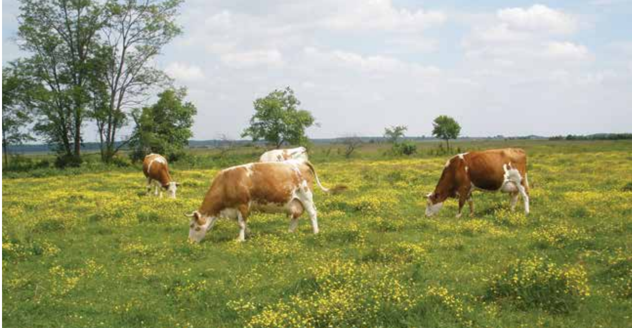
Slika: Krave na ispaši

zraku. Neizravno se smanjuje opterećenost objekta uzrokovana cjelogodišnjim držanjem goveda u zatvorenom prostoru, smanjuje se udio tekućeg gnoja i potrebe za njegovim skladištenjem.