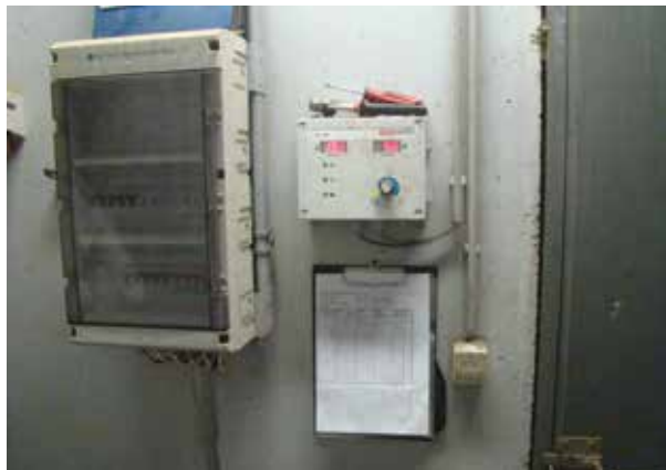
Slika: Vođenje evidencije u Finskoj

Prilikom kontrole na terenu potrebno je pokazati popunjen obrazac evidencije (u papirnatom ili elektronskom obliku).