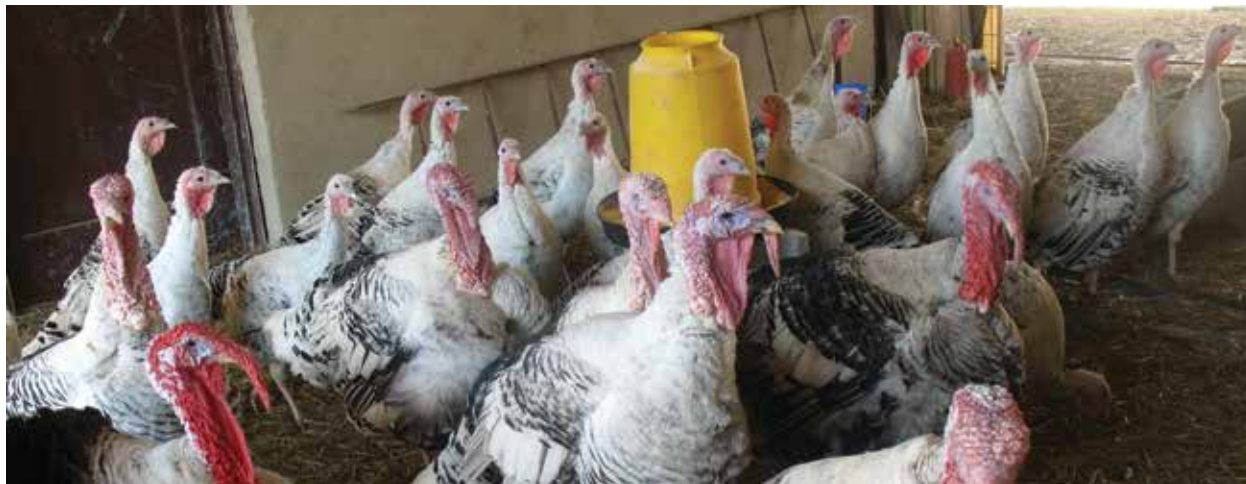
Slika: Izvor Hrvatska poljoprivredna agencija

Jedno od osnovnih prirodnih ponašanja kokoši je sjedenje na prečkama tijekom noći. Manjak mjesta na prečkama uzrokuje povećanje frustracije životinja i smanjuje dobrobit. Također gužva na prečkama može izazvati padove životinja što dovodi do loma kostiju ili sličnih ozljeda. Ukoliko nema dovoljno mjesta na prečki kokoši mogu koristiti druge dijelove peradnjaka za sjedenje kao npr. metalne dijelove iznad sustava za hranjenje i napajanje što može dovesti do onečišćenja hrane i vode.