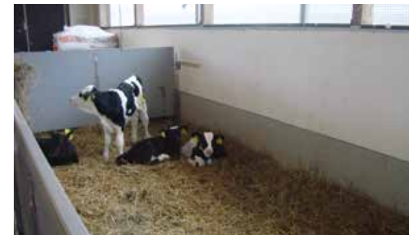
Slika: Primjer iz Finske

Poboljšanje uvjeta smještaja životinja može se postići i obogaćivanjem ležišta steljom. Primjena stelje u proizvodnim sustavima u govedarstvu smatra se izrazito korisnom za dobrobit životinja. Važnost stelje uglavnom se odnosi na udobnost pri odmaranju te pokrete koji se izvode pri ustajanju i lijezanju. Kod ovoga područja dobrobiti potrebno je omogućiti