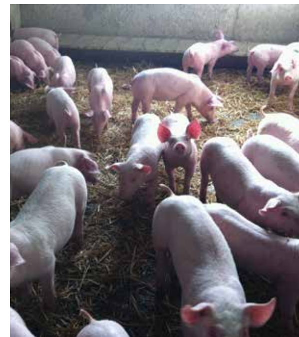
Slika: Izvor Hrvatska poljoprivredna agencija